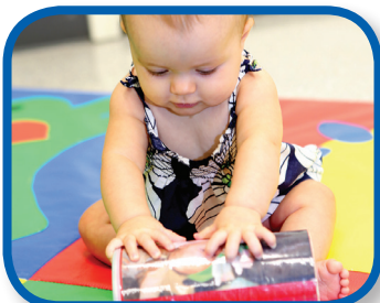
Mi familia De 6 a 12 meses