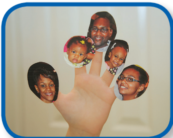
Canción de la familia de dedos De 3 a 12 meses