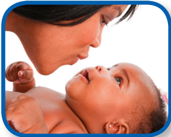
Conexión de ojo a ojo De 0 a 3 meses