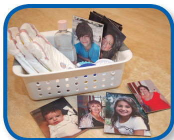
Family Photos 3-12 months