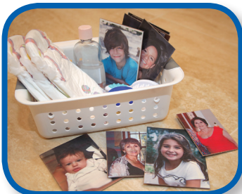
Fotos de la familia De 3 a 12 meses