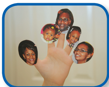
Family Finger Song 3-12 months